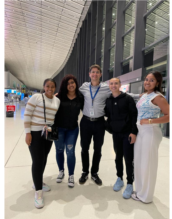
Estudantes PEC-G do Panamá partindo para o Brasil em 2023