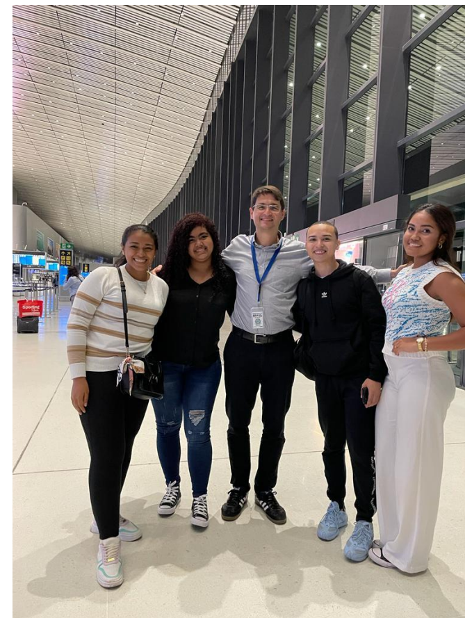
Estudantes PEC-G do Panamá partindo para o Brasil. 2023