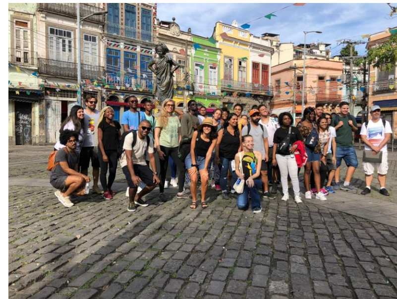
Estudantes PEC-G da UFRJ, in Rio de Janeiro