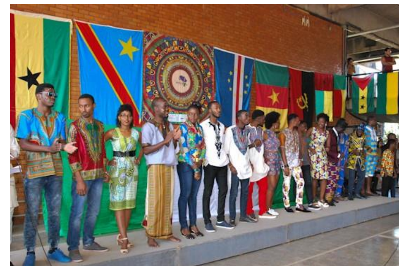
Estudantes PEC-G da Universidade de Brasília, UnB, 2022